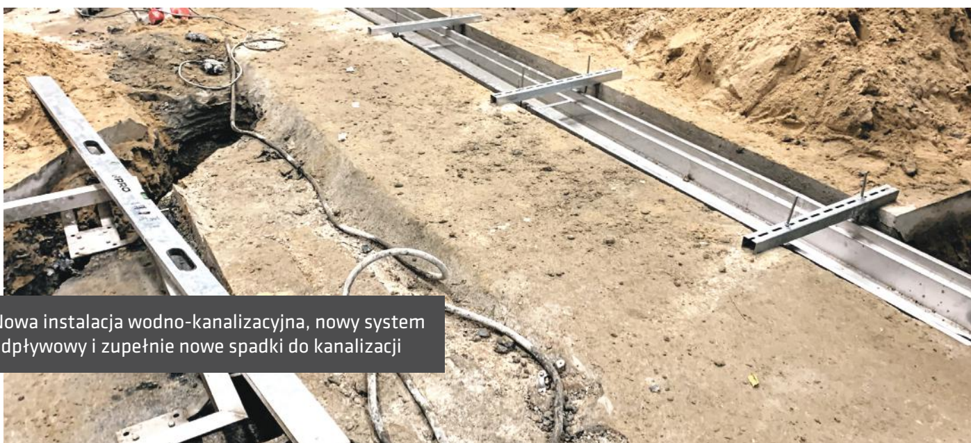
Nowa instalacja wodno-kanalizacyjna, nowy system odpływowy i zupełnie nowe spadki do kanalizacji

Stonhard zatrudnia 300 kierowników regionalnych i 175 ekip instalacyjnych na całym Świecie, które współpracują z Klientem w zakresie specyfikacji projektu, zarządzania projektami, końcowych inspekcji i serwisu posprzedażowego. Pojedyncze źródło gwarancji Stonhard obejmuje zarówno produkty, jak i instalację.